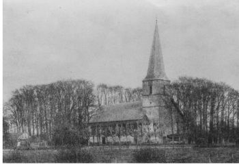
Afb. 2.13: Noordwestgevel van de kerk, z.j.

4. Op afbeelding 2.26 zijn scherp omliggende stukken land te zien. Hoe zit het daarmee?