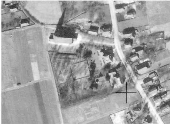
Afb. 2.26: Kerk met pastorietuinen, luchtfoto, 1947.

4. Op afbeelding 2.26 zijn scherp omliggende stukken land te zien. Hoe zit het daarmee?