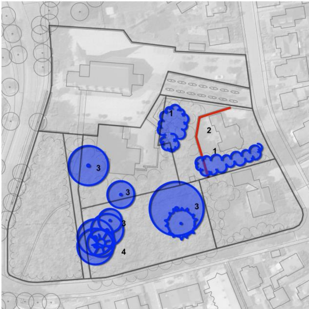
Afb 4.2: Elementen